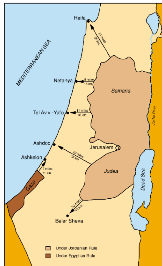
Distances between Israeli Population Centers and the Pre-1967 Lines

Tras la Guerra de Independencia de Israel, los territorios de la Franja de Gaza y de Cisjordania quedaron en manos de Egipto y Jordania. Esta situación geopolítica es altamente peligrosa para Israel, pues la eventual frontera se ubica en algunos sectores a sólo 15 kilómetros del mar.