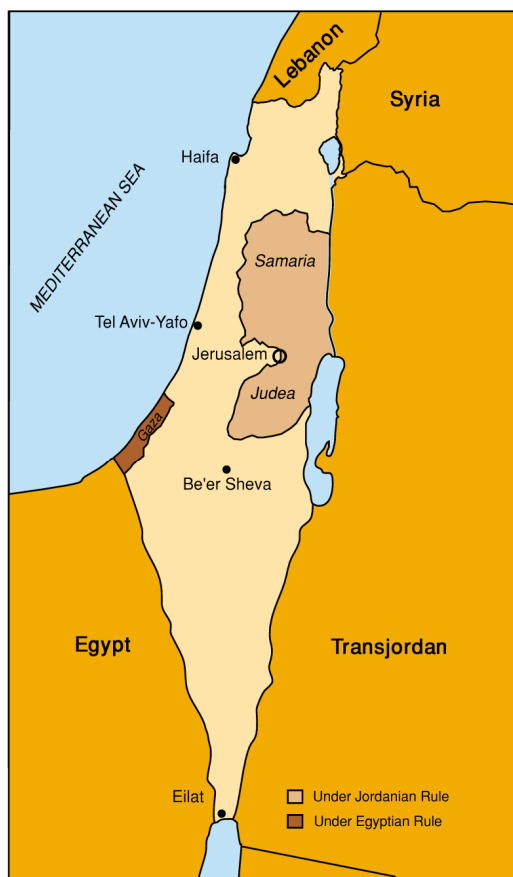
Armistice Lines, 1949

Durante 19 años, entre 1948 y 1967, los territorios de Cisjordania y Gaza estuvieron en manos jordanas y egipcias, respectivamente, sin que hubiera ningún intento de formar un estado palestino en dichas áreas, en un claro ejemplo de falta de solidaridad e identificación del mundo árabe con la causa palestina.