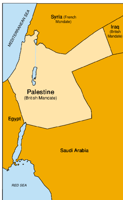
Area Allocated for Jewish National Home San Remo Conference, 1920

"El gobierno de su Majestad ve con beneplácito el establecimiento en Palestina de un hogar nacional para el pueblo judío y usará de sus mejores esfuerzos para facilitar el logro de este objetivo, siendo claramente entendido que nada se hará con la intención de perjudicar los derechos civiles y religiosos de las comunidades no judías existentes en Palestina, o los derechos y status político de que gozan los judíos en cualquier otro país.", Declaración Balfour, 1917.