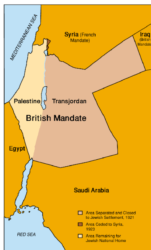
Great Britain's Division of the Mandated Area, 1921-1923

Las imágenes muestran el territorio históricamente conocido como la Tierra Santa, asignado al Mandato Británico en 1917. Una gran parte de este territorio asignado al Pueblo Judío por la Declaración Balfour del mismo año, se convirtió en un país árabe como es Jordania, tras una división administrativa realizada en 1922 por los británicos.